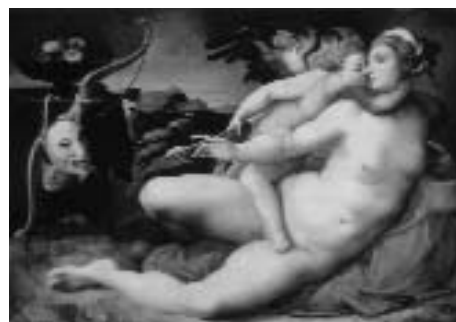
4. Attribuito a Hendrik van der Broeck, Venere e Amore , da Michelangelo. Napoli, Museo Nazionale di Capodimonte (dalla collezione Farnese).