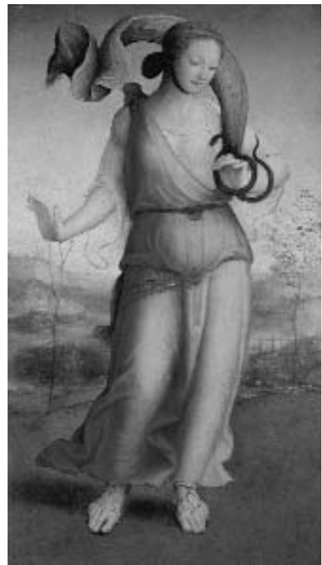
2. Maestro delle eroine Chigi Saracini, Cleopatra . Siena, Collezione Chigi Saracini.