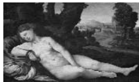
3. Attribuito a Jan van Scorel, Cleopatra morente . Amsterdam, Rijksmuseum.

Non si conoscono purtroppo le vicende più antiche dell'opera, che si deve immaginare sicuramente eseguita per un committente di rango, in grado di apprezzare e magari di sollecitare un dipinto per tanti versi raro. Unico, vago, indizio è la voce di un inventario della importante collezione napoletana di Francesco de Palma, duca di Sant'Elia, del 1716, dove è ricordata una Cleopatra copia da Marco da Siena, che probabilmente doveva ripetere la medesima 'invenzione', a testimonianza della fama, in antico, dell'opera 12 . Per determinarne una possibile datazione non resta dunque che affidarsi all'analisi dello stile, con i rischi di approssimazione che ciò comporta per un pittore come Marco, il cui percorso è, per mancanza di documentazione, ancora difficile da ricostruire, almeno per la parte centrale della sua