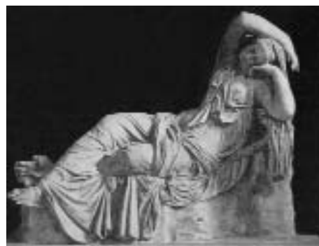
1. Scultore ellenistico, 'Cleopatra'. Roma, Musei Vaticani.

L' Arianna , statua ellenistica delle più celebrate — allora e fino all'Ottocento identificata proprio come Cleopatra, anzi ritenuta tra le più autorevoli immagini della regina, al punto da poter essere considerata il punto di partenza un po' per tutta l'iconografia rinasci-