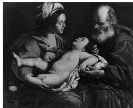
1. Rutilio Manetti, Sacra famiglia . Faenza, Pinacoteca comunale.

Accostando la Sacra famiglia con la Maddalena a queste opere del Manetti, oltre alla consonanza generale per il taglio compositivo, si noterà come la tela qui in esame s'ispiri soprattutto al dipinto di Faenza, arrivando a citarne con poche varianti la posa del Bambino, che ricorda pure la soluzione presente nel Miracolo del profeta Elia . Per la sistemazione del vecchio San Giuseppe in secondo piano i rapporti si svelano, invece, più stretti con la prima Presentazione al