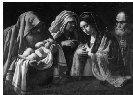
2. Rutilio Manetti, Presentazione di Gesù al tempio . Già a Londra, Sotheby's.

L'inedito dipinto qui presentato ben si confronta con la Sacra famiglia e San Giovannino della Pinacoteca soprattutto per i volti femminili d'ovale perfetto, che appaiono strettamente coerenti e rivelano una suggestione da modelli classicistici alla Guido Reni. Sono, inoltre, possibili significativi paragoni con altri dipinti attribuiti al Mei, che si possono datare prima della Processione con le reliquie di San Bernardino in piazza del campo (Siena, Oratorio di San Bernardino), documentata al 1639 7 . La paffuta fisionomia del Bambino dormiente è replicata per i volti d'alcuni angeli nella Glorificazione dell'Eucarestia (Monteriggioni, Compagnia del Corpus Domini ad Abbadia a Isola) 8 , del neonato Gesù nella Circoncisione (Siena, chiesa di San Rocco) 9 e dei tre ragazzi risuscitati da San Nicola in una pala d'altare con l'immagine del vescovo di Mira (Colle di Val d'Elsa, chiesa dell'ex Conservatorio di San Pietro) 10 . Preso atto che i dati sin qui indicati aiutano a indirizzare verso il riconoscimento della responsabilità del Mei per la Sacra famiglia con la Maddalena , mi sembra possibile trovarne conferma grazie all'accostamento con opere sicure del pittore, sul tipo del San Girolamo che traduce la Bibbia (Siena, Pinacoteca Nazionale) 11 , che è firmato e datato 1646. Oltre alla somiglianza per l'impaginazione delle figure, questi due dipinti mostrano più vincolanti affinità per l'impa-