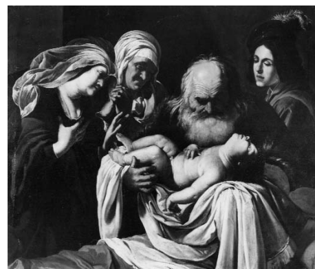
3. Rutilio Manetti, Miracolo del profeta Elia che resuscita il figlio di una vedova . Siena, Banca Monte dei Paschi.