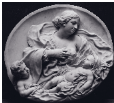
1. Giuseppe Mazzuoli, Madonna col Bambino e san Giovannino , marmo, cm 54,5 x 63. Münster, collezione privata.

Galleria Carlo Orsi, Milano; acquisto FMPS, luglio 2008.