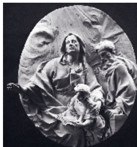
2. Giuseppe Mazzuoli, L'educazione della Vergine . Cleveland, Museum of Art.

allo scultore da quando aveva eseguito, all'inizio degli anni Settanta del Seicento, il paliotto marmoreo per l'altare maggiore della chiesa dello Spedale di Santa Maria della Scala a Siena, opera che avviò la sua carriera a Siena. Ne conosciamo esemplari oltre che nella già nominata collezione Chigi Saracini a Siena anche ad Augsburg in Germania e a Seattle (Washington).