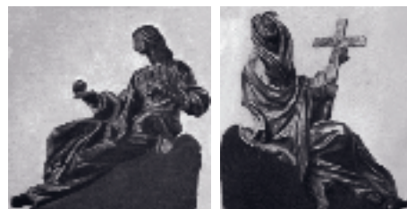
3-4. Giuseppe Mazzuoli, La Fede e La Religione . Già Vienna, mercato antiquario (1923).