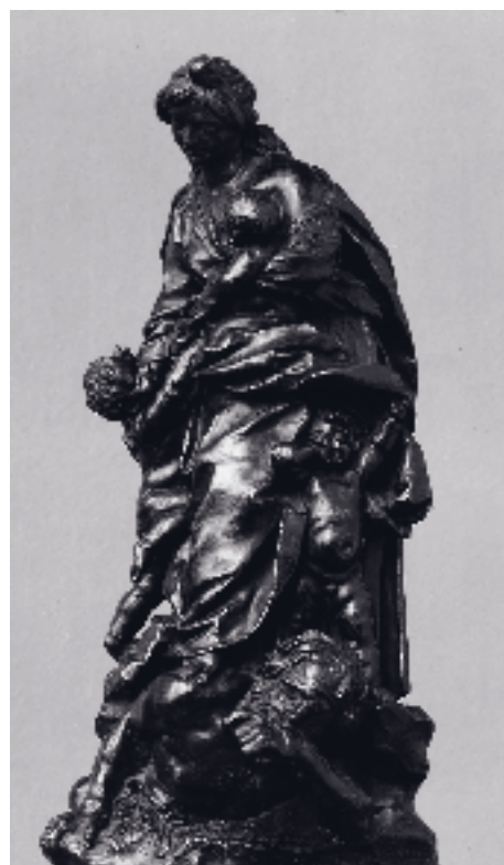
5. Giuseppe Mazzuoli, Carità con tre bambini calpesta il vizio dell'Avarizia che si morde la mano . Berlino, Preussischer Kulturbesitz.