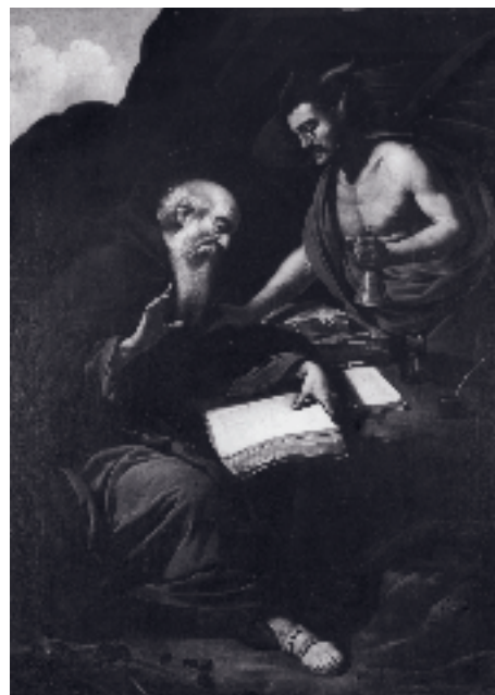
1. Rutilio Manetti, Sant'Antonio tentato dal diavolo . Siena, Sant'Agostino.

Davanti al tavolo da studio, il vecchio dottore della Chiesa è colto nel momento di un'autopunitiva meditazione: un testo sacro aperto, un teschio come memento mori trattenuto dalla mano sinistra, un sasso stretto nella destra, col quale si è appena percosso il petto, il volto sfigurato dalle rughe e dal grido di dolore, che si immagina provenire lungo, flebile e rauco dalla sua bocca socchiusa. Si tratta, insomma, di una prova magistrale nell'espressione degli affetti e nella lucida restituzione del naturale. La vicinanza con le opere dipinte dal Manetti intorno al 1630 e nella prima metà del decennio successivo è impressionante. Basterà far riferimento a prove che vanno dalla Visitazione con i Santi Giuda Taddeo e Bernardino (Massa Marittima, Sant'Agostino), firmata e datata 1631, fino alla serie di Santi a mezza figura ( Paolo , Siena, Museo civico; Pietro , Siena, Banca Monte dei Paschi; Matteo , Siena, Pinacoteca Nazionale), sottoscritti dal Manetti e con la data 1636 inscritta sul registro di conti che tiene San Matteo 1 .