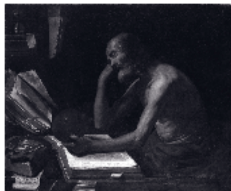
2. Rutilio Manetti, San Girolamo in meditazione . Già a Londra. Sotheby's, 26 ottobre 1988.