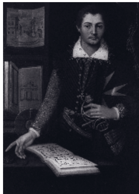
7. Vincenzo Rustici, Ritratto di Pietro de' Vecchi . Siena, collezione privata.