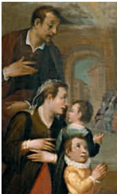
8. Vincenzo Rustici, Sant'Ansano battezza una bambina (particolare).