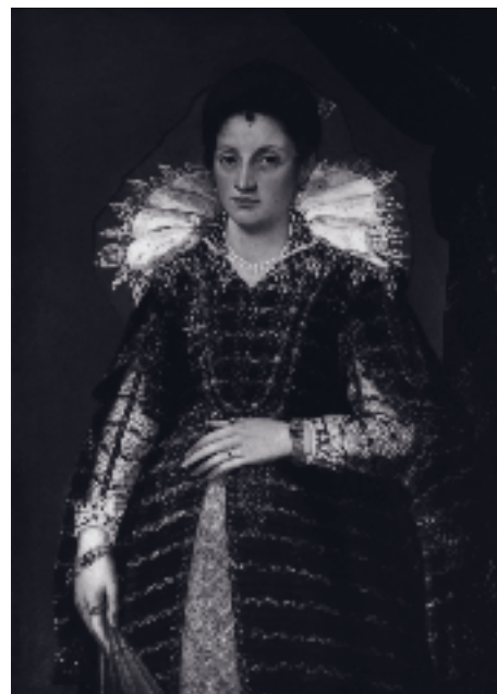
6. Vincenzo Rustici, Ritratto di Giulia Verdelli de' Vecchi . Siena, collezione privata.

Ancora procedendo a ritroso, credo che si debba sciogliere in favore di Vincenzo l'attribuzione del Ritratto di Pietro de' Vecchi e del Ritratto di Giulia Verdelli de' Vecchi 7 , che documentano il punto di stile più vicino a quello del Sant'Ansano che battezza la bambina . Potendo contare su prove egregie come queste tre tele,